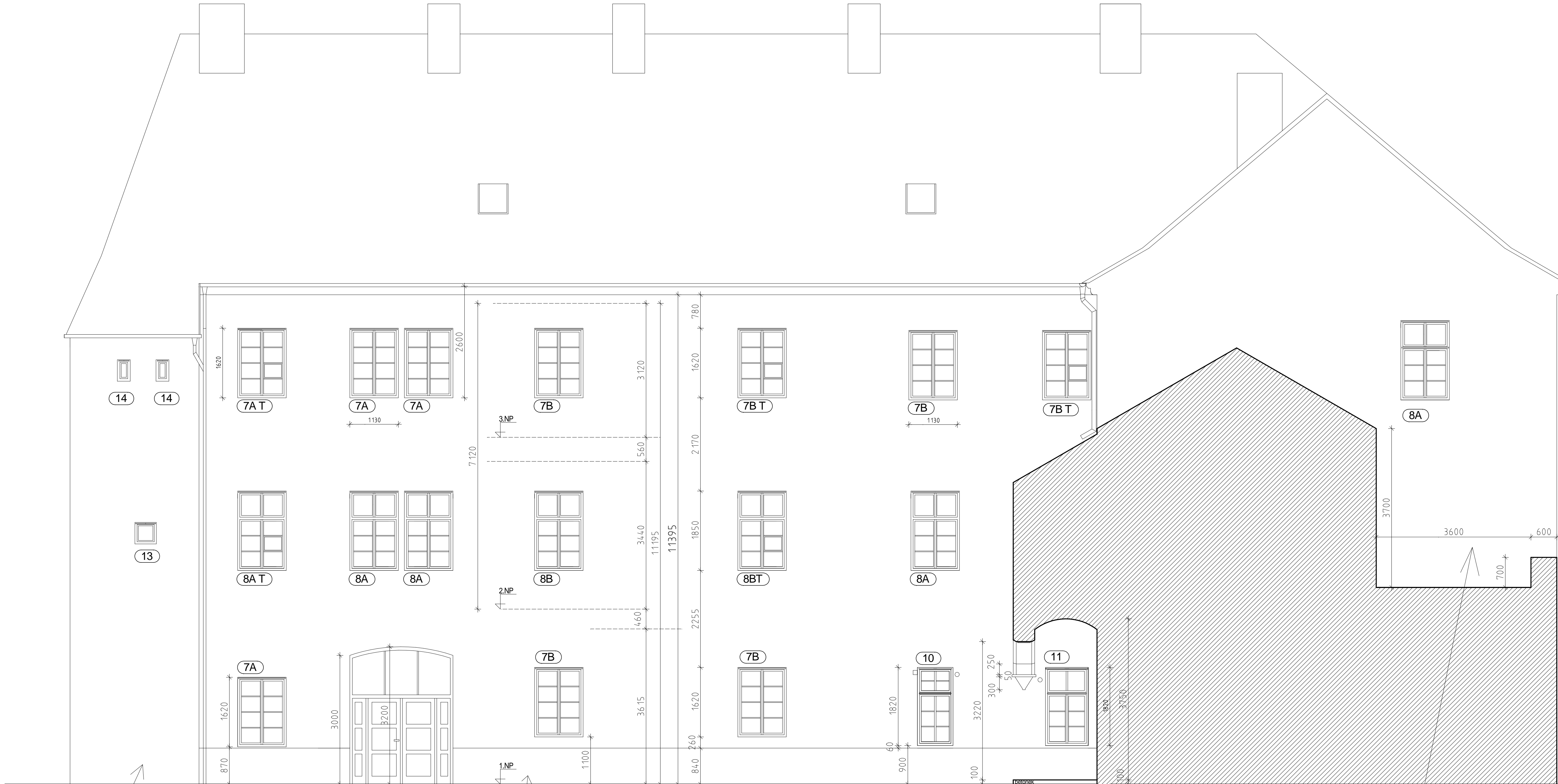
POHLED "H" - NA SEVERNÍ KŘÍDLO ZE DVORA